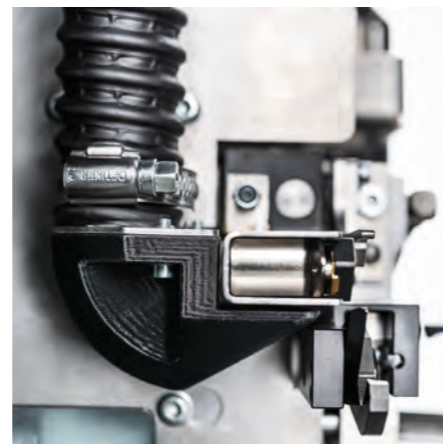
Optionale Absaugvorrichtung für Abisolierreste